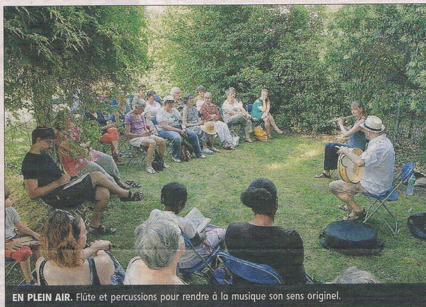
EN PLEIN AIR. Flûte et percussions pour rendre à la musique son sens originel.

Les deux musiciens se connaissent de longue